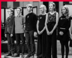
Academie Muzikaal Talent