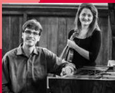
Duo Besemer en De Man

Programma Kamermuziekserie in de Vredebergkerk te Oosterbeek